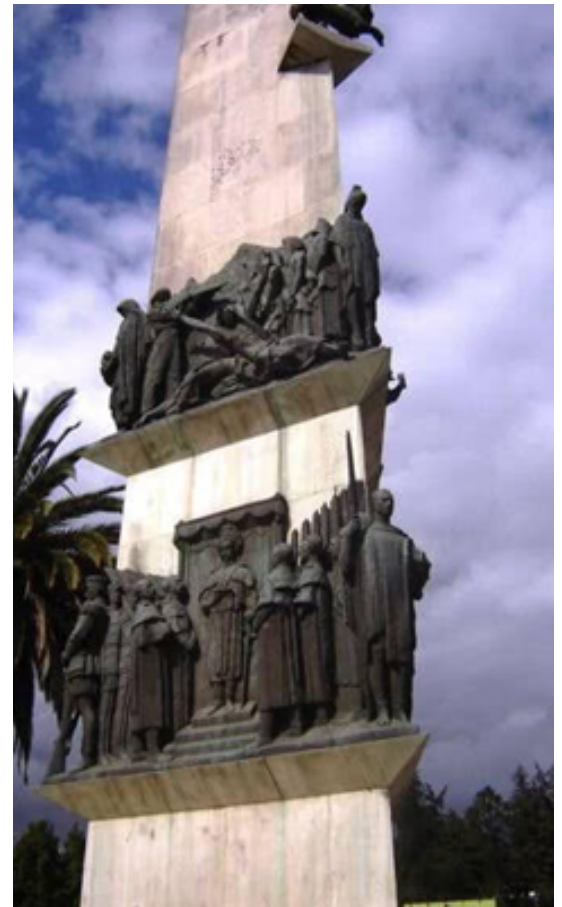
Memoriale per Yekatit 12 ad Addis Abeba

[1] La reputazione di Graziani per la repressione feroce gli valse il soprannome di "Macellaio del Fezzan".