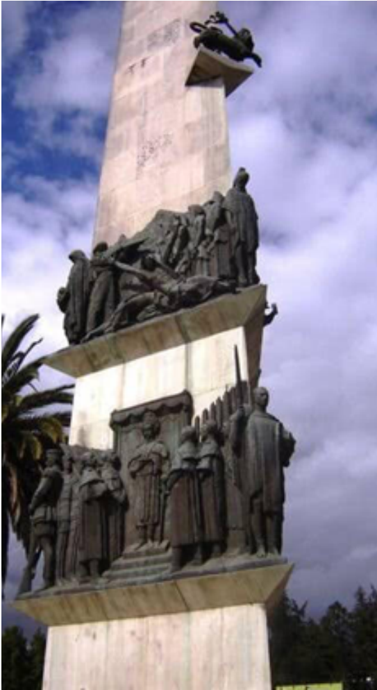
የየካቲት 12 መታሰቢያ የሰማዕታት ሐውልት

የኢጣልያ መንግሥት አዲስ አገዛዝ መሠረት የነበረው የዘር መድልዎና የአፈና ሥርዓት አዲስ አበባ ላይ ሰፈነ። ኢጣልያ የነጭ የበላይነትን መርሕ ያደረገ ሥርዓት አስርዓ ኢትዮጵያ የኢጣልያ ምሥራቅ አፍሪካ ግዛት አካል መሆኗን በማወጅ ግራዚያኒን ገዥ አድርጎ ላከች። ርዶልፎ ግራዚያኒ ከዚያ ቀደም ብሎ ሊብያ በነበረበት ግዜ በጭካኔው ስም የተከለና[1] ከዚያም ሶማሊያ በነበረበት ግዜ በጅምላ ፍርድና በጭካኔው የሚታወቅ ነበር። በኢጣልያ አገዛዝ ኢትዮጵያውያን የበታች ሆነው በፍርሃት እንዲፍሩ ተደረገ። ግራዚያኒ “ኢትዮጵያውያን ቢፍሩም ባይፍሩም” ኢትዮጵያ የሙሶሊኒ እንደምትሆን ቃል በመግባት ጭካኔ የተሞላበትን አገዛዝ በመቀጠል የኢትዮጵያውያንን የነፃነት ተጋድሎ የመግታት ጥረቱን አፋፋመ። የኢጣልያ መንግሥት ተፅዕኖ በጉልህ ይታይ የነበረው በከተማዎች ሲሆን፣ ከከተማዎች ራቅ ሲል የአርበኞች እንቅስቃሴ ያይል ነበር። የግራዚያኒ ትኩረት የነበረው አገር ማስተዳደር ላይ ሳይሆን የአርበኞችን እንቅስቃሴ መደፍጠጥና ማፈን ላይ ነበር።